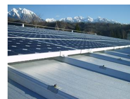
Circolare 1324 del 07/02/2012

A disposizione per eventuali chiarimenti tecnici.