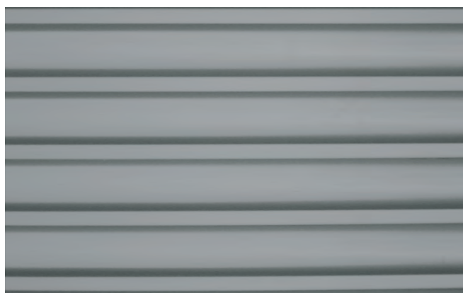
Montaggio orizzontale - Horizontal mounting