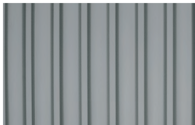
Montaggio verticale - Vertical mounting