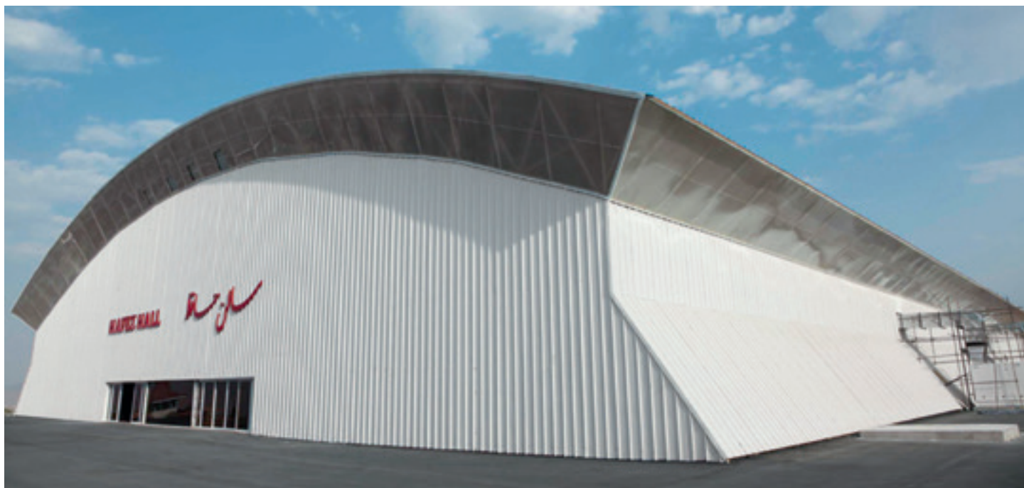
Types de profilages